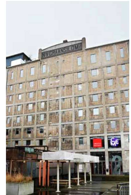
MAASSILO BUILDING / Rotterdam, The Netherlands