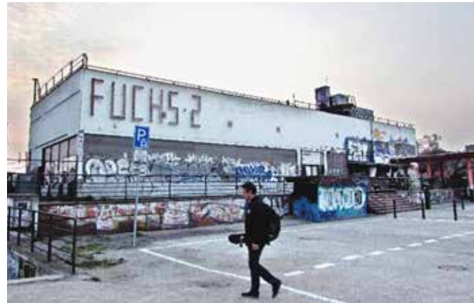
WINTER STADIUM RESTAURANT AT ŠTVANICE / Prague, Czech Republic