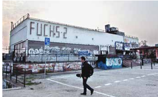
ΕΣΤΙΑΤΟΡΙΟ ΧΕΙΜΕΡΙΝΟΥ ΣΤΑΔΙΟΥ ΝΑ ΣΤΒΑΝΙΣΚΙ / Πράγα, Τσεχία