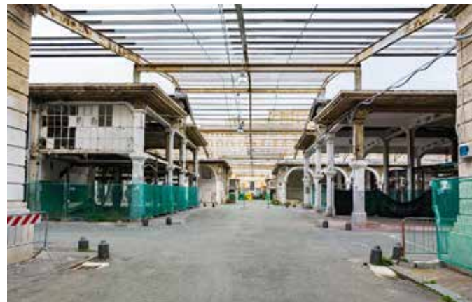
ΑΓΟΡΑ ΛΑΧΑΝΙΚΩΝ ΚΑΙ ΦΡΟΥΤΩΝ CORSO SARDEGNA / Γένοβα, Ιταλία