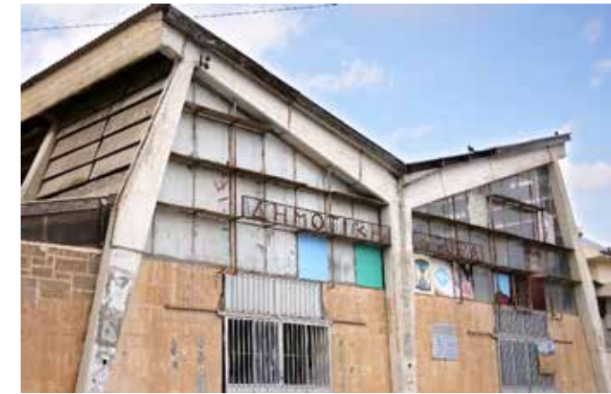
MĚSTSKÉ TRŽIŠTĚ / Athienou, Kypr