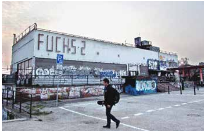
ZIMNÍ STADION A RESTAURACE NA ŠTVANCI / Praha, Česká republika